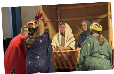
...och vise män!