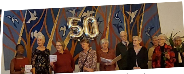
I femtio år har besöksjänsen arrangerat julfest för bygdens seniorer.