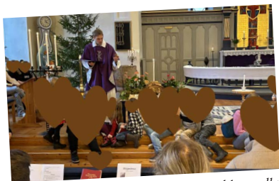
Fjärde advent i Himmeryds kyrka: krubbans alla figurer hamnade till slut på sina rätta platser.