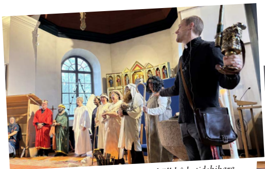
Årets julspel för traktens skolor innehöll både tidskikare,