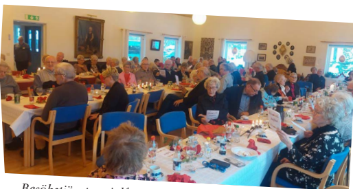
Besöksjänsens julfest med hundratalet gäster blev inte bara mycket trevlig som vanligt utan var dessutom den 50e gången som den arrangerades.